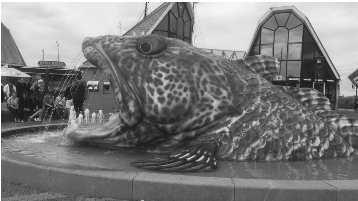
Foto 1 is het gemeentehuis van Sloten en hierboven staat de Waterpoort van Sneek. Het visje hieronder vind je in Stavoren.